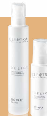
DELICE emulsione lenitiva post fotoepilazione

Per rendere il servizio con Dermopeel un'eccellenza per il tuo salone ti offriamo i prodotti Electra Tech Cosmetics , specifici per lavorare in sinergia con le tecnologie e per aumentare l'efficacia di un risultato sicuro.