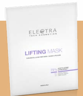
LIFTING MASK trattamento liftante e antirughe